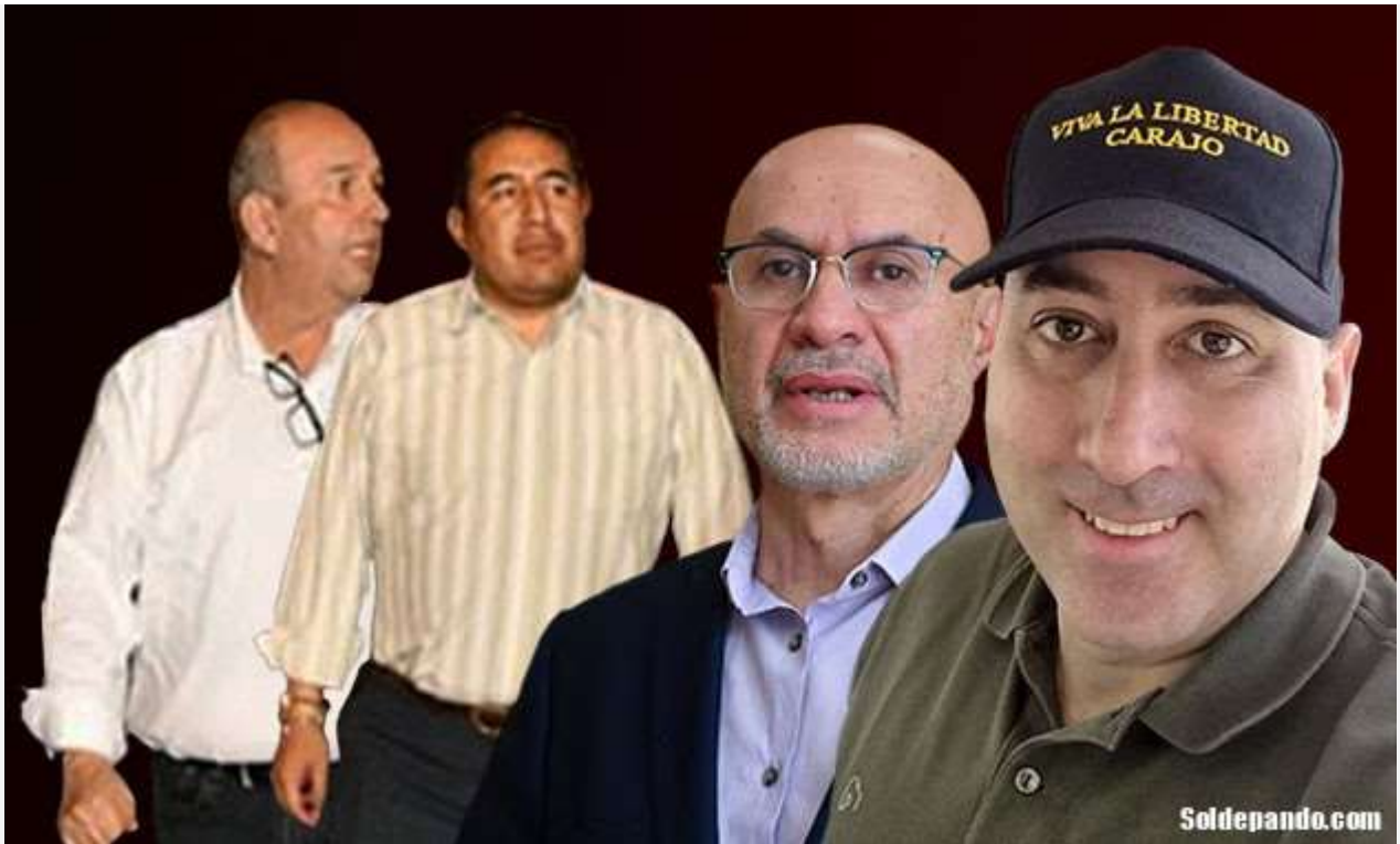
Santamaría, el secuaz de Murillo que aspira a ser el nuevo Ministro de Gobierno, tendría respaldo del ministro José Luis Lupo y del cuestionado asesor presidencial argentino Fernando Cerimedo.