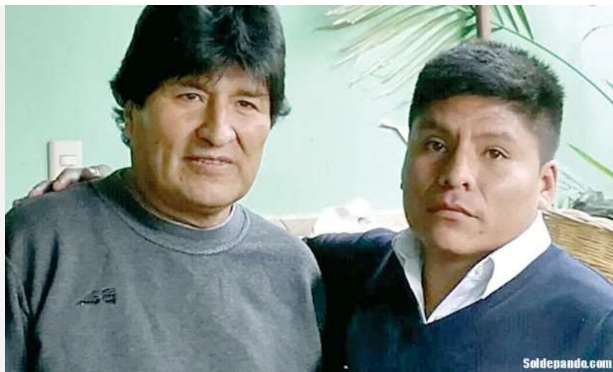
Cunde el temor de que Evo Morales tome control de las decisiones en el Gobierno Departamental, por encima de Leonardo Loza.

Súmame, el partido de Reyes Villa, derrota al partido cocalero en la provincia Cercado con un caudal de 137.225 votos (36%) frente 100.728 votos (26%) de A-UPP, sobre el 92,50% de las actas computadas. Sin embargo este caudal urbano representa el 43% del padrón electoral de Cochabamba. El 57% de los votantes están en las demás 15 provincias indígena-campesinas donde Loza tiende a superar el 40% de los votos y los índices de Súmame se hunden en un promedio no mayor al 25%.