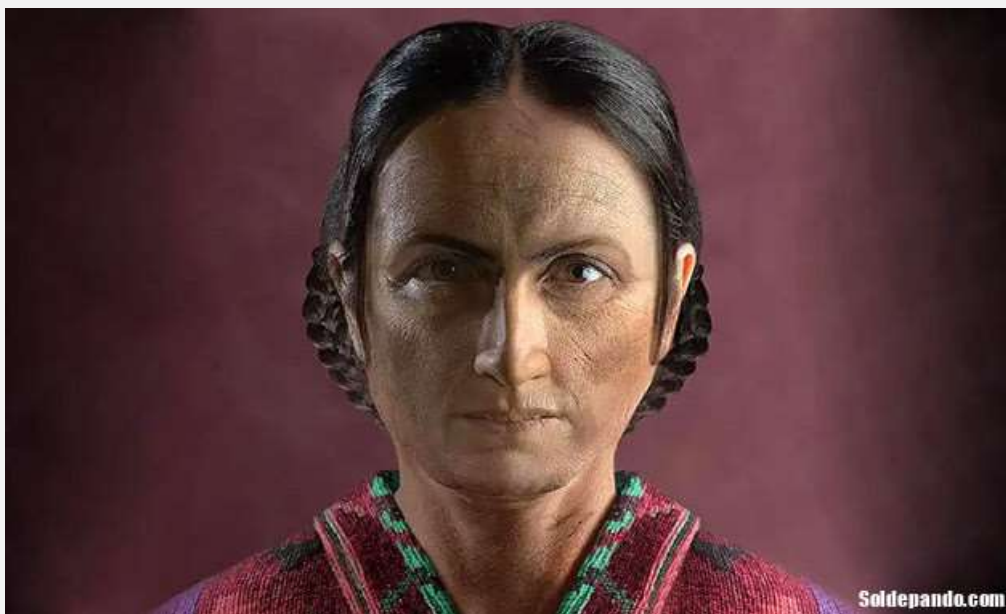
Imagen digital de Juana Azurduy de Padilla (2021), diseñada por el artista gráfico Ramiro Ghigliazza, Argentina.

Benjamín Torres rastreó aquel certificado y no sólo rescata la grafía original del apellido sino que da con la fecha original de su nacimiento, que no es el 12 de julio de 1780. Será en enero de ese año su nacimiento, al haber sido bautizada el 26 de marzo, dos meses después de nacida tal como especifica el acta parroquial.