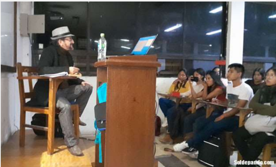
El Director de Sol de Pando afirmó que los concejos municipales en todo el país tienen la obligación constitucional de conformar los jurados de Imprenta, sin esperar ser necesariamente presionados por los gremios del periodismo.

“Desde que se restableció la democracia municipal en 1985, los concejos municipales han venido evadiendo sistemáticamente la obligación que les impone el artículo 21 de la Ley de Imprenta para conformar los jurados ciudadanos encargados de enjuiciar delitos de imprenta; se ha llegado incluso al extremo de eliminar en la nueva Ley Orgánica de Municipalidades esa competencia que en anteriores leyes municipales estaba mencionada explícitamente”, señaló el periodista durante el conversatorio con estudiantes de la cátedra Procedimientos Especiales que dicta en la UMSS el prestigioso abogado y docente universitario Henry Pinto Dávalos.