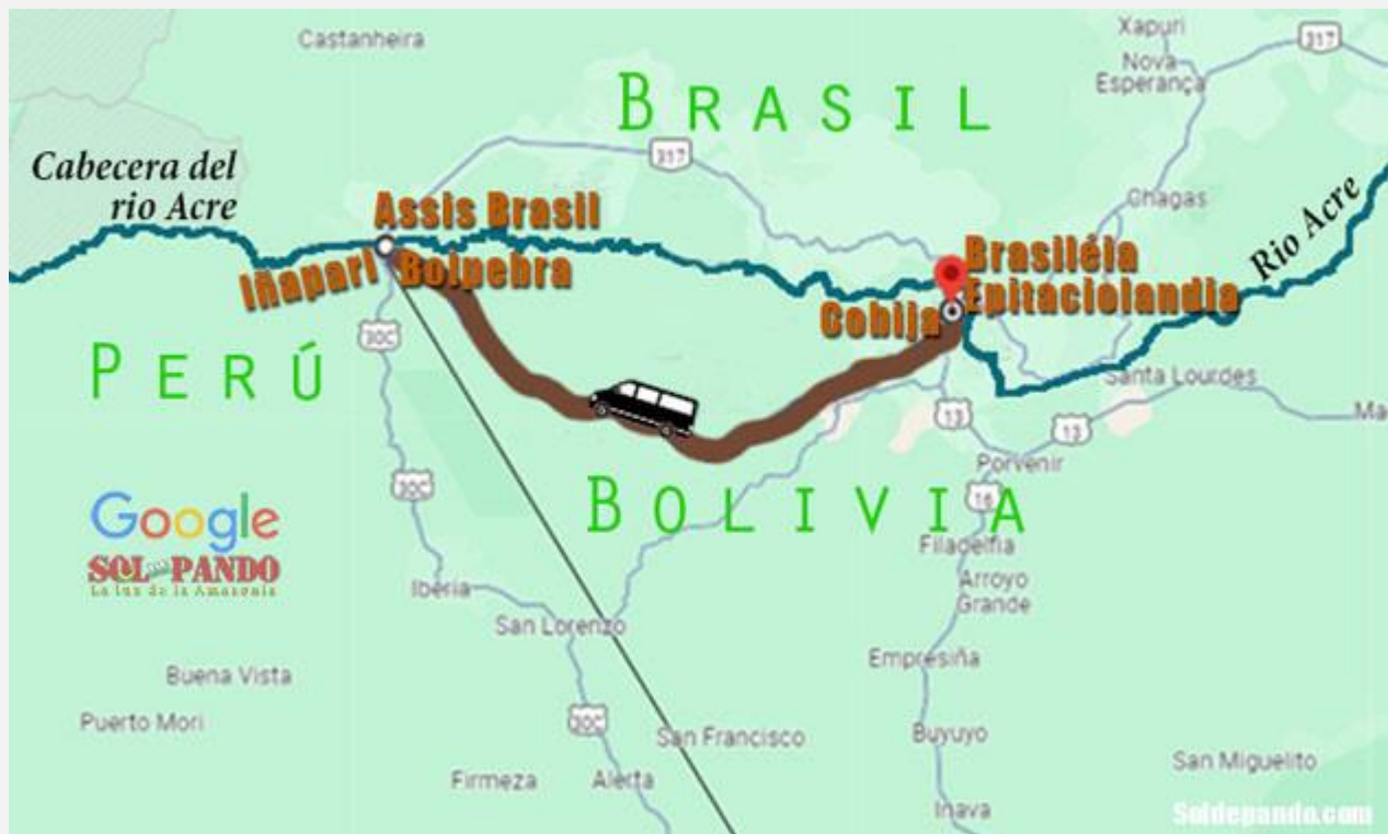
En su trayecto hacia las desembocaduras del Amazonas, el río Acre anuncia la magnitud de sus inundaciones con las alertas que emite en la triple frontera de Bolpebra, Assis Brasil e Iñapari. | Infografía Sol de Pando

Los datos hidrotelemáticos de la Agencia Nacional del Agua (ANA) del Brasil, consultados por Sol de Pando, indican que el trasvase desde la cabecera del río en la triple frontera (Bolpebra, Assis Brasil e Iñapari) hacia los municipios de Cobija, Brasiléia e Epitaciolândia llegará hoy a su punto culminante —siempre y cuando no llueva— y las aguas comenzarán a disminuir en toda la cuenca, a un ritmo estimado de dos a tres centímetros por hora.