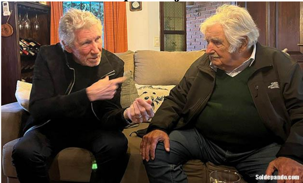
Al día siguiente del recital, finalmente Roger Waters pudo reunirse con Pepe Mujica, el ex Presidente uruguayo cuyo discurso libertario fascina al músico británico.

Al día siguiente, finalmente Roger Waters pudo reunirse con Pepe Mujica, el ex Presidente uruguayo cuyo discurso libertario fascina al músico británico. El encuentro se produjo la tarde del sábado en la casa de Mujica y su esposa Lucía Topolansky.