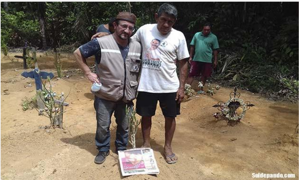
La de Busi, es una tumba en aislamiento voluntario, sin ninguna señal cristiana ni pompa alguna...

Busi era hermana de Baji y Busi Pistia, las tres hijas de Papa Yacu y Cai Baji. Sus primos cruzados Buca, Toi y Maro, eran hijos de Papa Yacu y Cai Xacu. Papa Yacu era un jefe guerrero Pacahuara que llegó a Alto Ivon a fines de los años sesenta del siglo pasado, junto a sus siete hijos y sus dos esposas, las hermanas Cai Baji y Cai Xacu.