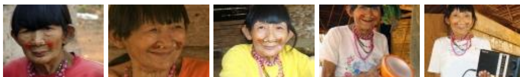
[VER IMÁGENES EN DIAPOSITIVAS]

A orillas del río Ivon, en Riberalta, el norteamericano soñaba instaurar un modelo judeo-cristiano del paraíso terrenal, habitado por devotos indígenas profiriendo parábolas bíblicas en sus lenguas nativas, como si fueran menonitas, con la bendición y el financiamiento de USAID. Prost había concebido una utopía monstruosa, funcional a los propósitos etnocidas del extractivismo en ascenso. Logró su nefasto propósito con los Chacobo, pero no pudo con los Pacahuara.