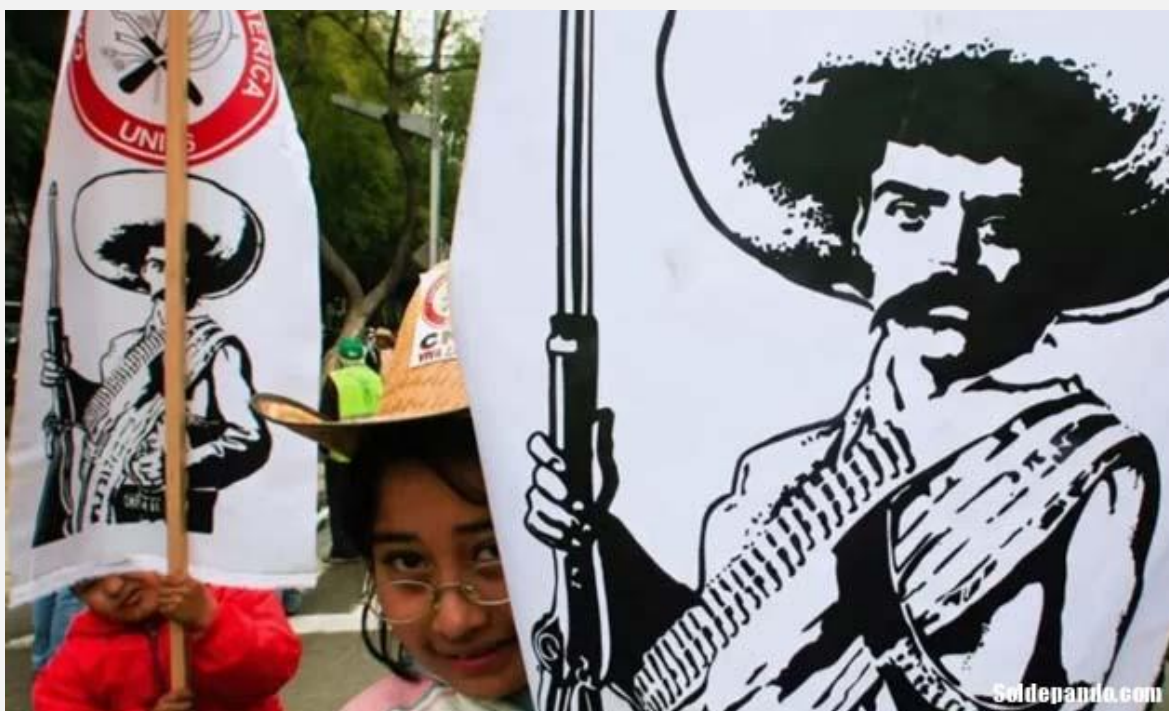
Recordar la muerte de Emiliano Zapata es parte de la cultura y la memoria de los pueblos latinoamericanos.

El pasado viernes, 7 de abril, la Fundación Zapata Herederos de la Revolución, a través de su representación en Bolivia, entregó al vicepresidente David Choquehuanca una carta manifestando la predisposición del bisnieto de general Zapata para visitar el país.