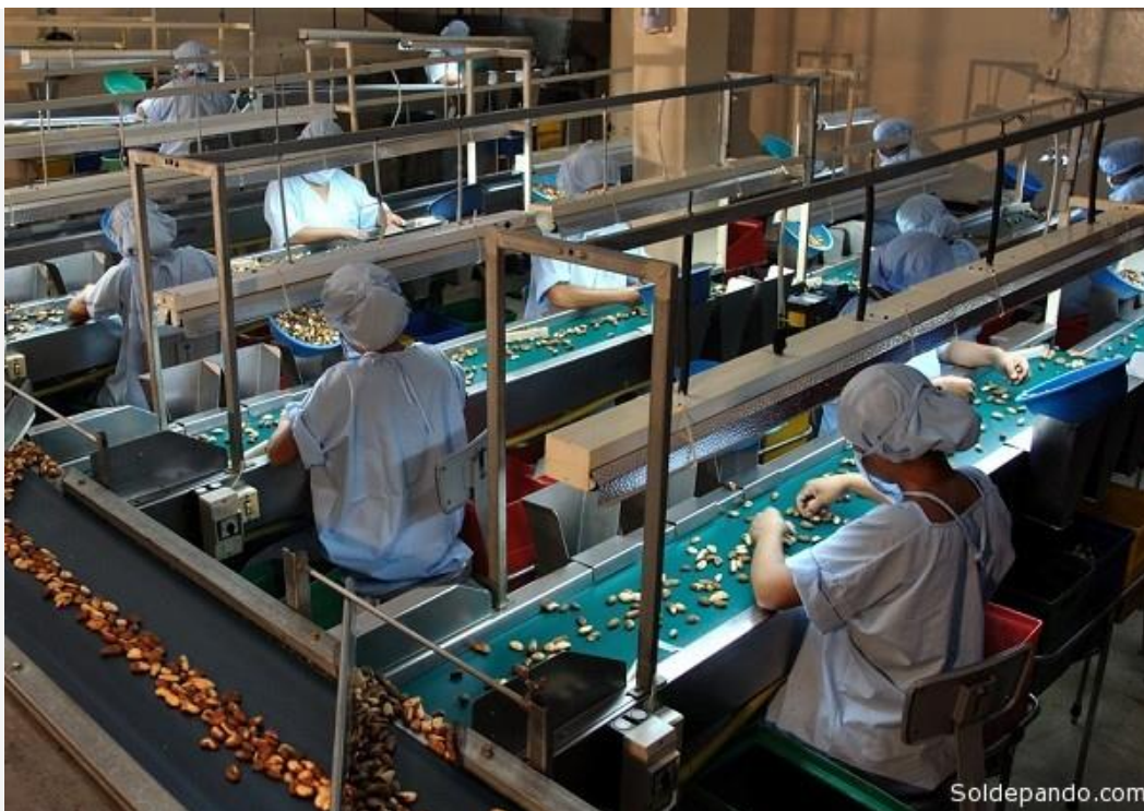
Planta fabril de procesamiento de castaña en instalaciones de la empresa Tahuamanu, que funciona en la ciudad de Cobija.

Para lectura en móvil usar pantalla horizontal |