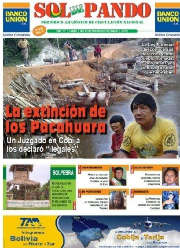
Publicado: Primera quincena de marzo, 2011