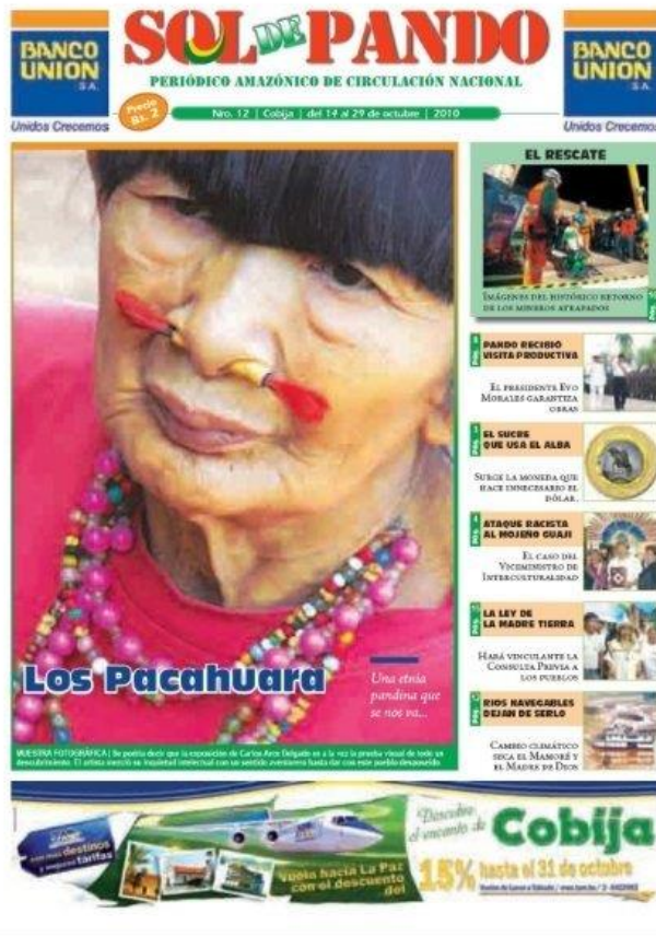
Publicado: Primera quincena de octubre, 2010