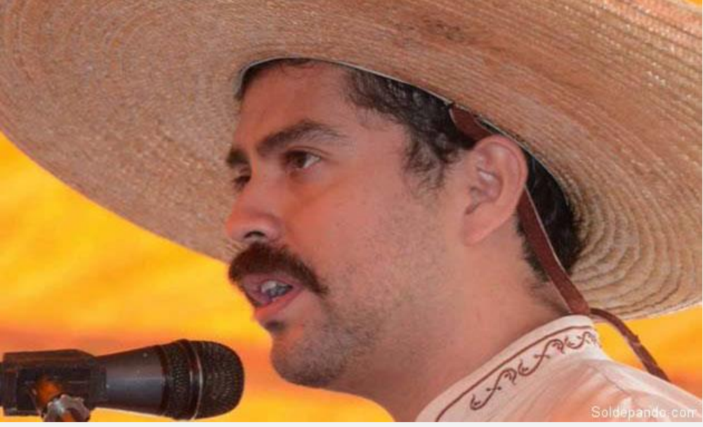
El descendiente de Zapata es consciente del peso que conlleva su responsabilidad como heredero y custodio de una memoria histórica tan densa que no termina de ser plenamente descubierta.