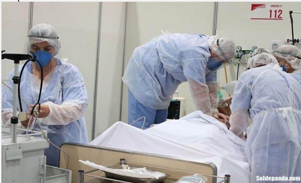
El sistema hospitalario del Acre está colapsando con la llegada de pacientes provenientes de Manaus, tras la crisis del oxígeno en la capital del Estado de Amazonas.

El Gobernador del Estado do Acre , Gladson Cameli, se comunicó el martes con el Ministro de Relaciones Exteriores, Ernesto Araújo, para pedir formalmente al Gobierno Federal el cierre de las fronteras internacionales de la zona acreana. La respuesta del Palacio de Itamaraty demora. “El Canciller aún no respondió a nuestra demanda y alega que iniciará las consultas del caso” , informó el gobernador Cameli a tiempo de anunciar que el Gobierno Estadual del Acre tomará la decisión en el marco de sus propias competencias.