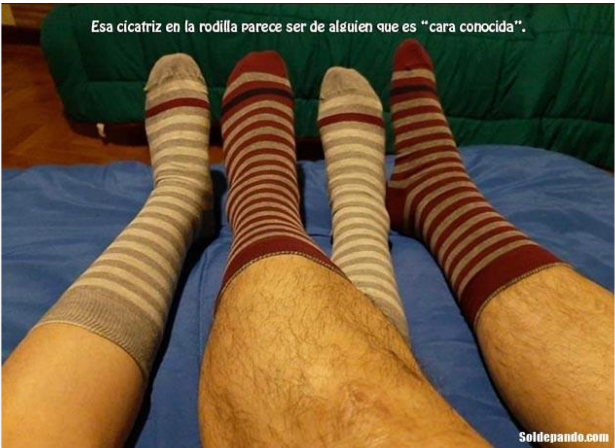
Fotografía hallada en el celular de la concubina de Evo Morales, el pasado 12 de julio.

Esa cicatriz en la rodilla parece ser de alguien que es "cara conocida".