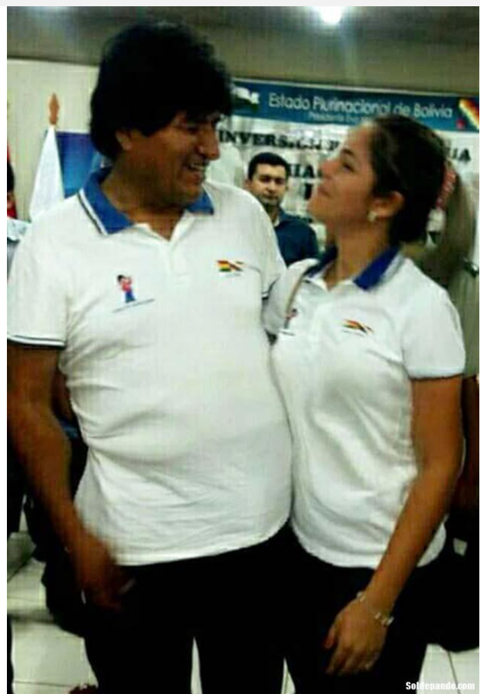
Evo Morales y Eva Humérez, un resultado de los narco-vínculos de Juan Ramón Quintana en Pando.

de apellido (confidencial). Si están ligados a él, se confirma que Quintana es quien maneja los asuntos sexuales de Evo Morales, ya sea con adolescentes como la hija de Achacollo o con prostitutas que el mismo Quintana traía de Brasil mediante su amante (y también de Evo) la diputada pandina Eva Humérez (futura Senadora)".