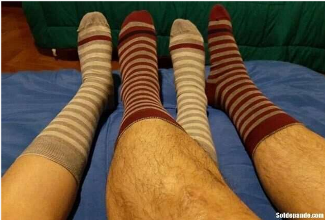
Fotografía hallada en el celular de la concubina de Morales, el pasado 12 de julio.