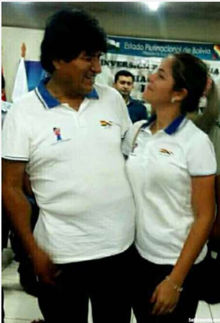
Evo Morales y Eva Humérez, un resultado de los narco-vínculos de Juan Ramón Quintana en Pando.

Durante nuestro exilio en Brasil, habíamos logrado establecer que el grupo de Quintana utilizaba el control de las fronteras para fomentar no sólo el narcotráfico sino también el tráfico de menores de edad con fines de prostitución. No sólo Yacuiba. La ciudad de Cobija fue otro centro de reclutamiento a donde llegaban con engaños mujeres y niñas brasileñas, desde el Estado do Acre, para ser insertadas en una red de prostitución que se extendía por las ciudades de Santa Cruz, Cochabamba, La Paz y Arica, en Chile. Tras esa investigación de Sol de Pando, los traficantes protegidos por Quintana enviaron sicarios desde Cobija a Río Branco para ajusticiarnos. La Policía Federal del Brasil detectó la tentativa y decidió nuestra evacuación a la capital federal Brasilia, en coordinación con la Diócesis del Acre.