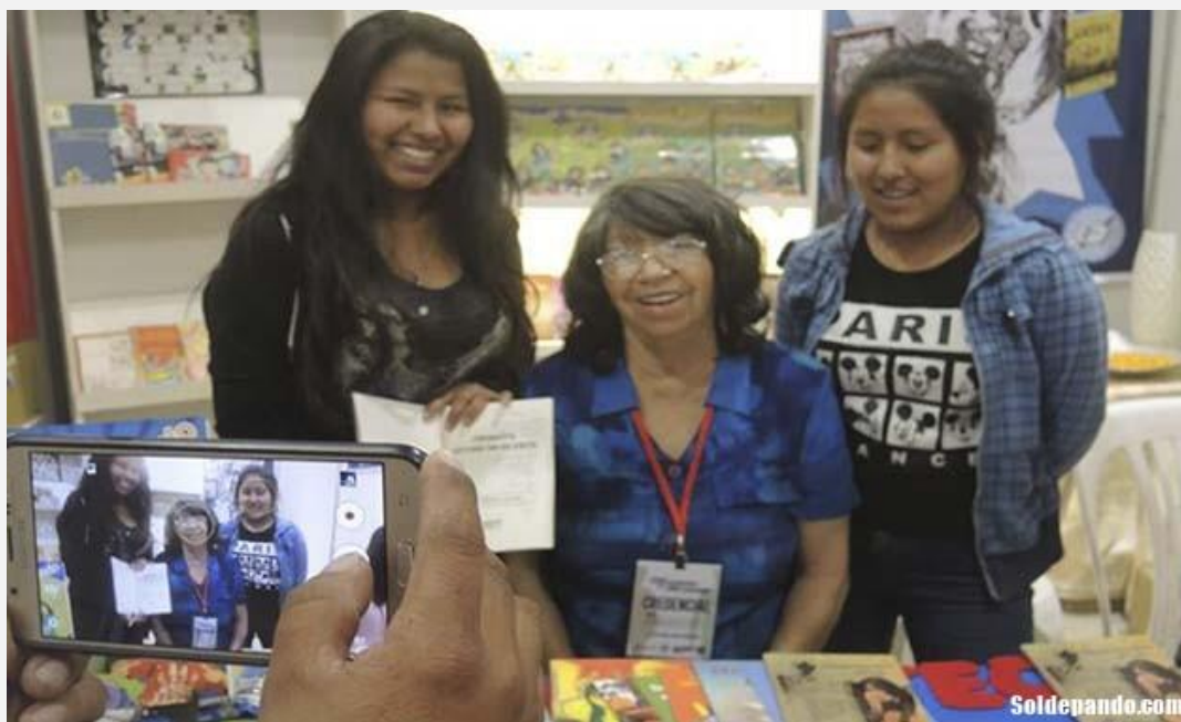
A partir de 1992, con la colaboración de otras maestras y escritoras, la biblioteca codificaría en sus registros más de 10.000 títulos dedicados al público infantil.

Esa carita embarrada será, pues, el ícono del niño boliviano leyendo cuentos y poemas.