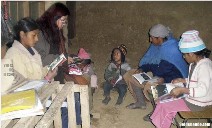
Y así fue cómo la escritora nacida en los alrededores de Tarata se convirtió en artífice y pionera del género infantil boliviano entre las décadas de que unen a los siglos XX y XXI.

No era vana la cavilación. La galardonada novelista que expurgaba demonios con sus relatos críticos de la historia boliviana, ella que hacía fantásticas metáforas de la sexualidad femenina con su prosa mordaz, se sentía incompleta si no escribía cuentos para los niños de un país esencialmente indígena.