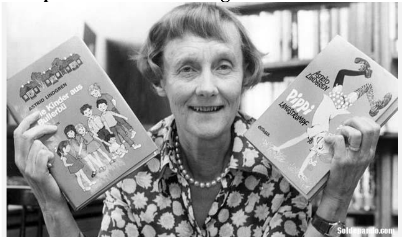
El galardón mundial para la Literatura Infantil lleva su nombre en homenaje a la escritora sueca Astrid Lindgren, nacida el 14 de noviembre de 1907 en Vimerby, Suecia.

Durante la última década, el prestigio de la Biblioteca Thuruchapitas ha trascendido las fronteras de Bolivia recibiendo galardones y reconocimientos de instituciones mundiales como la Organización Internacional para el Libro Juvenil (IBBY) con sede en Alemania y la Comisión de Bibliotecas e Información Científica de