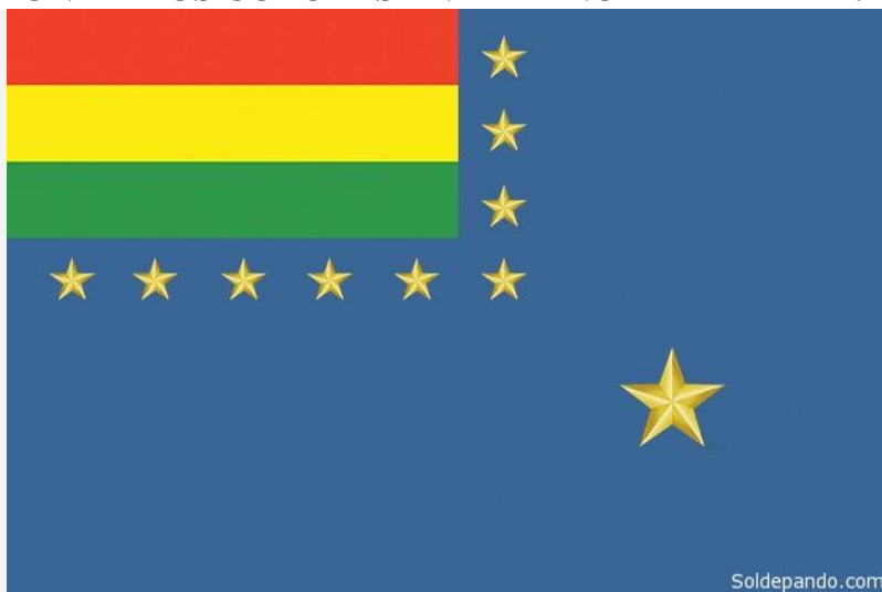
El Pabellón Naval de la Armada Boliviana, creado mediante el Decreto 7583, el 13 de abril de 1966. Esta norma se halla constitucionalmente vigente en la actualidad.