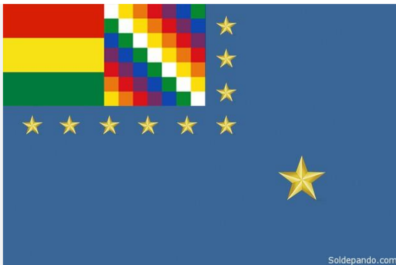
La Bandera de la Reivindicación Marítima del Estado Plurinacional de Bolivia, que mediante los artículos 4 y 5 de la Ley 920 actualiza el Pabellón Naval de 1966 agregando la wiphala y manteniendo la esencia del Decreto 7583, es decir el color Azul Mar .

El 21 de marzo del 2017, 51 años después del Decreto de Ovando, el Senado Nacional sancionó la Ley 920 creando la Bandera de la Reivindicación Marítima del Estado Plurinacional. Se mantiene el diseño original del Pabellón Naval de 1966 —pues el Decreto 7583 no fue formalmente derogado ni abrogado—; con el único añadido en el ángulo superior izquierdo, junto a la tricolor, de la wiphala que representa al actual proceso de una nueva configuración estatal.