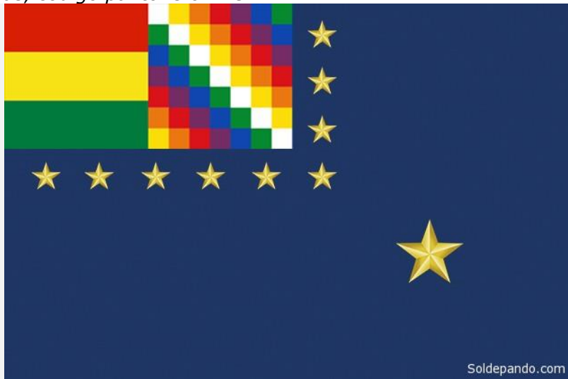
Inexplicablemente, el artículo 6 de la Ley 920 promulgado el 27 de marzo de 2017 se contradice con los artículos 4 y 5 de la misma norma, al adoptar el Azul Marino como color oficial de la Bandera de la Reivindicación Marítima del Estado Plurinacional.

Resulta entonces que el nuevo Pabellón Naval lleva exactamente el mismo color de la bandera proselitista del partido gobernante ( azul marino ); y al parecer no por mera casualidad como puede objetivarse en la contradictoria redacción de la Ley 920, aprobada y sancionada ante la indiferencia de los mismos legisladores de la oposición anti-evista.