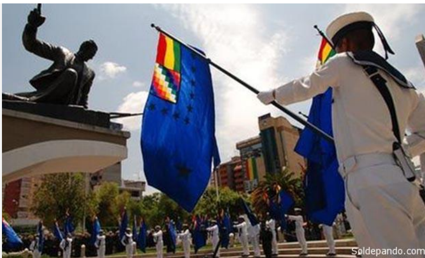
Desde septiembre del 2015, incluso antes de aprobarse la Ley 920, la Fuerza Naval de Bolivia lleva como su emblema oficial de arma la nueva bandera azul.