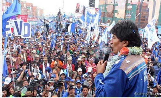
El Presidente durante la campaña para su tercera reelección en 2014. Indumentaria y banderas partidarias "azul marino".

La Ley 920 que el presidente Morales promulgó hace un año para "legalizar" la fusión del Pabellón Naval con la bandera partidaria, podría ser un boomerang contra el propio Evo. "Hay un grado preocupante grado de irresponsabilidad en esa maniobra política del Gobierno" —advierte el sociólogo Jorge Komadina—. "Adulterar una ley para falsificar el color de un emblema patriótico con fines electorales, rompe toda posibilidad de consenso y unidad nacional en torno a la reivindicación marítima".